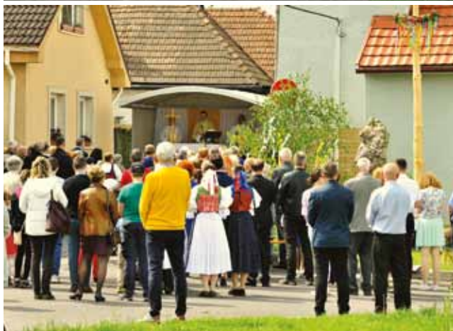
Hodová slávnosť v Necpaloch - 8. mája 2022