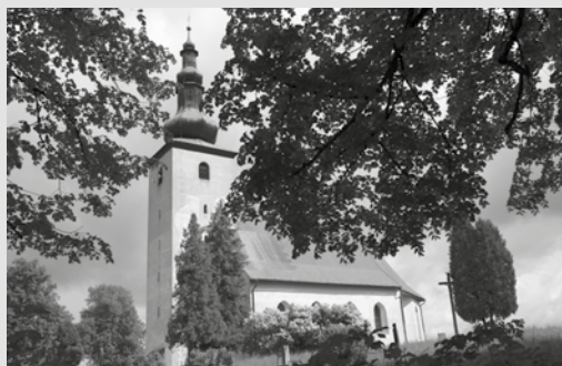
Kostol Narodenia Panny Márie v Sklenom