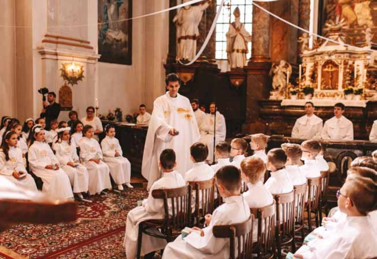
Prvé sväté prijímanie, piaristický kostol v Prievidzi - 1. mája 2022