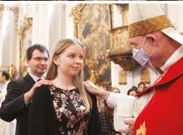
Kostol Najsvätejšej Trojice v Prievidzi, sviatosť birmovania, 29. mája 2022